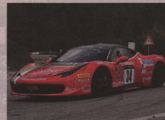
Roberto Ragazzi vero mattatore del gruppo GT con la Ferrari 458 Superchallenge. MORETTI

Classifica Assoluta 1. Faggioli punti 152,5; 2. Meri 125; 3. Scola 83. Gruppo Racing Start RS 1. Scappa p. 170; 2. Chiaravelli 88,5; 3. Fabiane 66. RSTB 1. Pezzolla p. 150; 2. Montanaro 148,5; 3. Tacchini 90. Gruppo N 1. Hafner p. 137,5; 2. Pisa 111,25; 3. Regis 75,25. Gruppo A 1. Biciotto p. 142; 2. D'Amico 117,5; 3. Parlatto 56,5. Gruppo E1 1. Nappi p. 132,5; 2. Giuliani 117,5; 3. Gramenzi 82,5. Gruppo GT 1. Ragazzi p. 150; 2. Cannavò 129,5; 3. The Clamber 77,5. Gruppo CN 1. Magliana 150; 2. Iaquineta 145; 3. Conticelli F. 88. Gruppo E2/B 1. Faggioli p. 152,5; 2. Meri 127,5; 3. Scola 80. Gruppo E2/M 1. Bettura p. 104; 2. Pedrotti 79; 3. Leogrande 76.